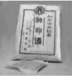
『加世田血のくすり・神命湯』

「神命湯」は、葛根、川芎、蘇葉、芍薬、当帰、茯苓、香附子、羌活、陳皮、白朮、遠志、牡丹皮、酸棗仁、地黄の十四種類の生薬から構成される処方だ。