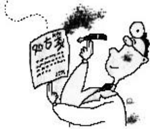
医師の処方から名薬が生まれた

また、明治初期までこの一帯は加世田郷と区割りされていたことが『加世田血のくすり』の呼称の由来である。